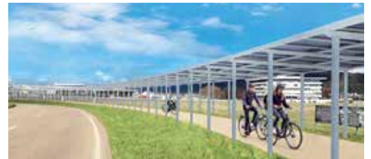
Produktion von Solarenergie und sichere und geschützte Velowege: Beispiel einer innovativen und klimafreundlichen Mobilitätslösung.